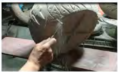
陶瓷修坯過程暴露粉塵