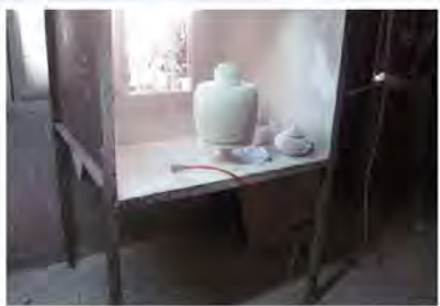
噴釉作業過程粉塵瀰漫 (無設置噴漆水洗台)